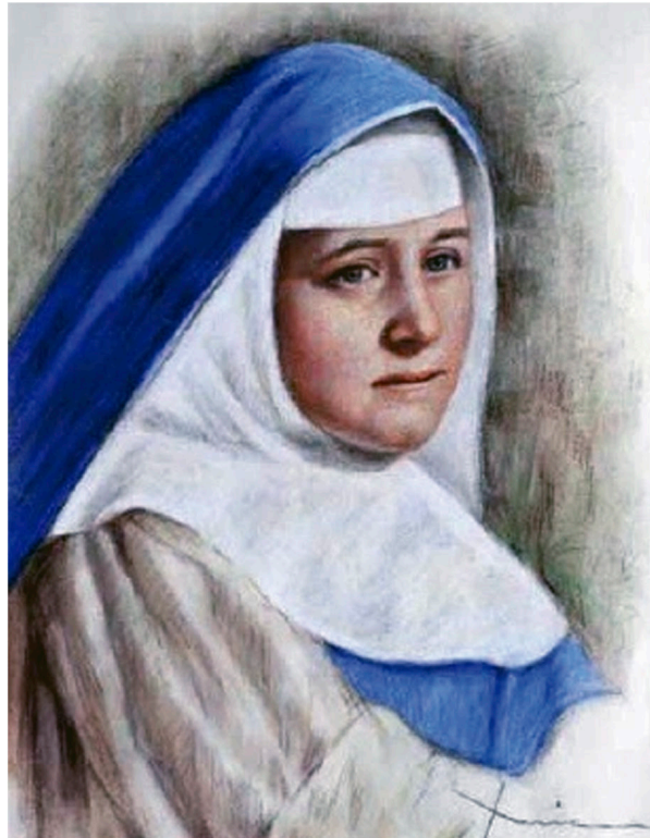
Sta Carmen Sallés y Barangueras Fundadora RR Concepcionistas Misioneras de la Enseñanza